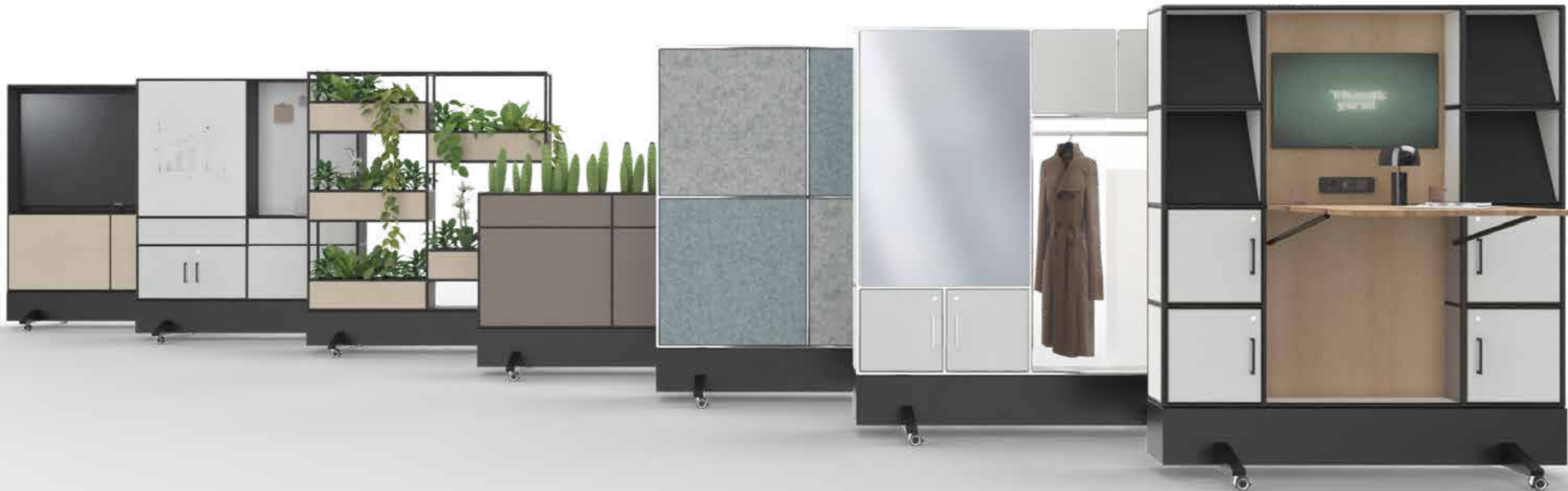
MODUL SPACE MOBILE SCREEN