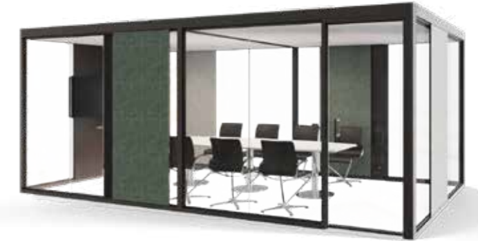
CUBE 4.0 TELEPHONE CALL PRIVATELY.